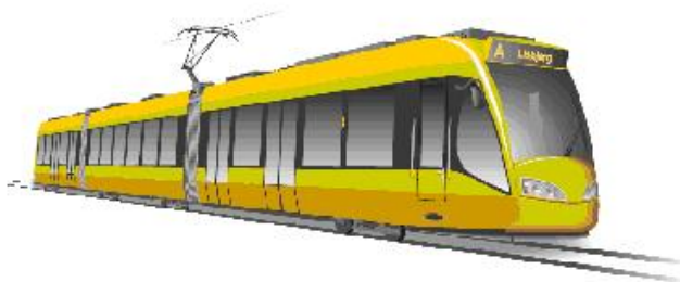
Letbane i Århus